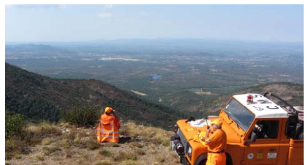
CCFF Le Cannet des Maures