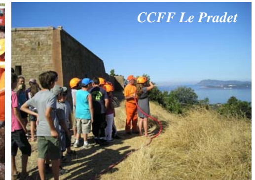
CCFF Le Pradet