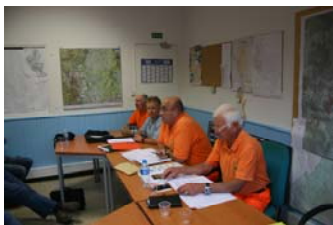
Réunion de secteur à Solliès-Pont